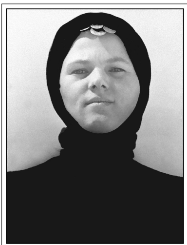
Nuraga Softić : Statua, 1964.

aktivan. Ovaj skromni, blagi i riječju umjereni čovjek i danas prevrće po svome foto arhivu pokušavajući da stvori za neke nove generacije "zapis o vremenu", želeći da sačuva od zaborava krajolike i ljude svoga djetinstva, koje neumitno guta napredak i modernizacija.