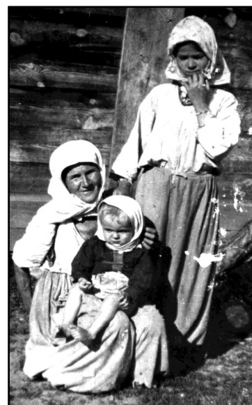
Fotografija načinjena box kamerom iz 1951. godine

njima pričaju o sebi, krajolici odišu sjećanjem na djetinjstvo. On na fotografijama najčešće prikazuje muslimansko selo, bilježeći život u njemu i pokušavajući da ga otrgne od zaborava i prebrzog napretka, koji neumitno nadolazi u "rudarskom okruženju". Poseban i veoma značajan dio njegovog foto arhiva čini dokumentarna etnografska fotografija stvarana u posljednjih četrdeset godina, jedinstvene i neprocjenjive vrijednosti. .... Kao izuzetno kvalitetnom fotografu Foto-savez BiH ga 1967. godine proglašava za počasnog člana, a svjetska fotografska asocijacija (FIAP) 1975. godine dodjeljuje mu zvanje AFIAP. Foto-savez Bosne i Hercegovine dodjeljuje mu 1996. godine za dostignuti nivo u fotografskom stvaralaštvu zvanje majstor fotografije. Nuraga Softić iako sa preko 70 napunjenih godina još je