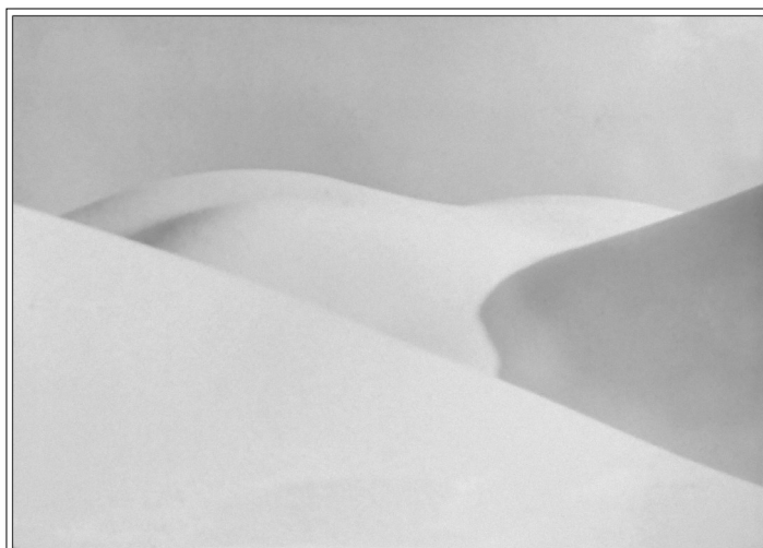
Nuraga Softić : Akt (Zimski brežuljci), 1967.