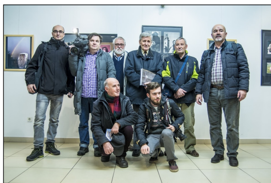
Zajednički snimak zeničkih fotografa sa autorom i predsjednikom AUFBiH

na svoj specifičan način, bilo da se radi o motivu ili tehnici, zabilježio vrijeme u kojem je živio, pejaže bosanskih krajolika, portreta običnog svijeta. Kako se fotografijom počeo baviti veoma rano, on je i kao profesionalni fotograf ostao jedan od rijetkih koji je opstao u svijetu umjetničke fotografije - izjavio je Ozren Božanović predsjednik AUFBiH.