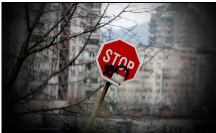
Osmanović Tarik : Stop

I ove godine u organizaciji FKK Tuzla i AMK Tuzamk Tuzla održana je izložba fotografija na temu - saobraćajna nekultura. Izložba je održana u sklopu Desetog Festivala filma i fotografije mladih - učenika srednjih i osnovnih škola iz BiH. Nažalost i ove godine obezbjeđeno je samo učešće učenika osnovnih škola sa područja Tuzlanskog kantona, dok je zahvaljujući Zajednici srednjih tehničkih i stručnih škola BiH odaziv srednjih škola bio sa cijele teritorije BiH. Na takmičenje je prispjelo 176 fotografija od 66 učenika osnovnih i srednjih škola. Uku-