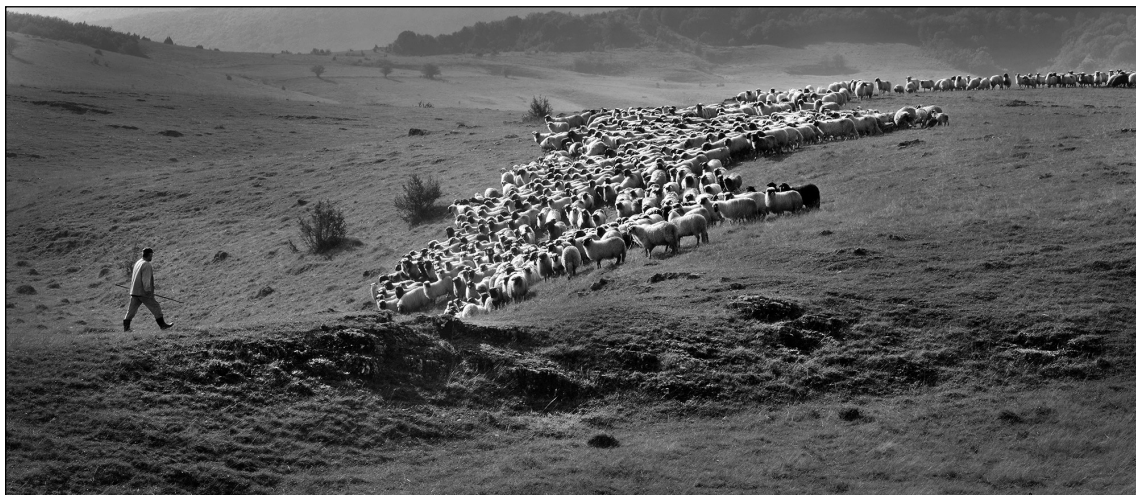
Dragan Prole : Prema stadu