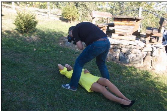
Foto safari Babići 2019