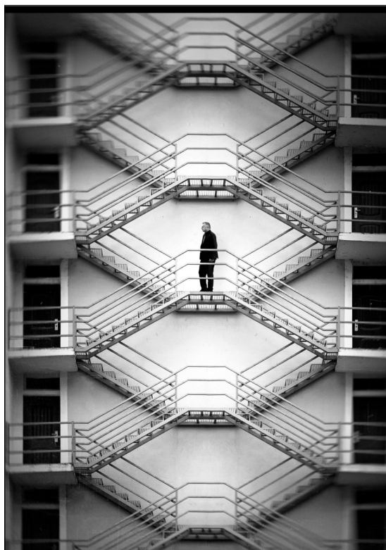
Nermin Smajić : Simetrija

da je ova postavka u Prnjavoru u čast njihovog građanina Peje.