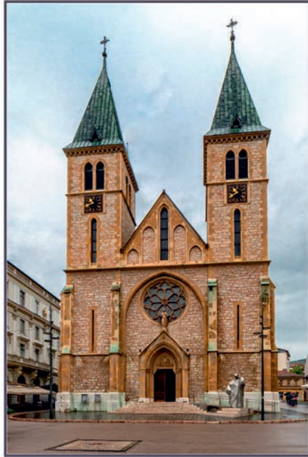
Katedrala Srca Isusova Sarajevo