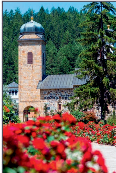
Manastir Svetog Nikole Ozren