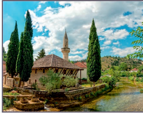
Džamija Hadži-Alije Hadžisalhotića (Cuprijska džamija) Stolac