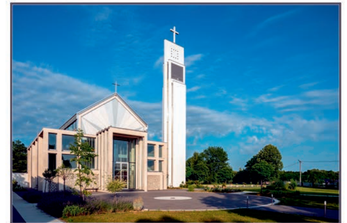
Crkva rođenja Blažene Djevice Marije u Ulicama kod Brčkog