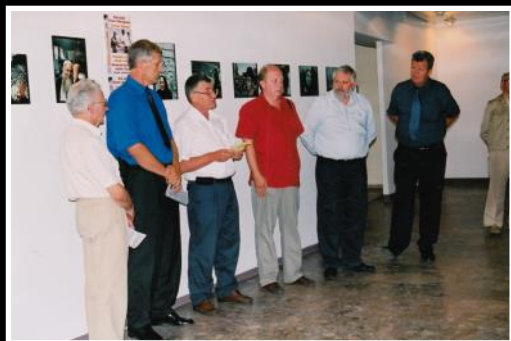
2002, godina BKC Tuzla - otvaranje izložbe Palestina i Izrael sukob i suživot